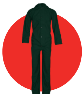
WARONA 5400 Art. nr. 2.45.415.00