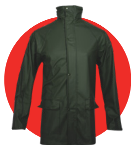
WALAKA 5200 Art. nr. 2.45.215.00